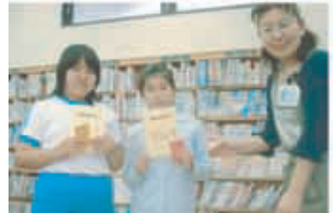
よむよむラリーで楽しくゴール！ （布佐分館にて）