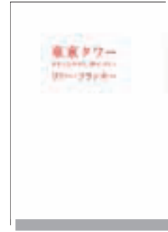
『東京タワー』 リリー・フランキー 扶桑社