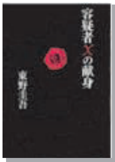
『容疑者Xの献身』 東野圭吾 文藝春秋