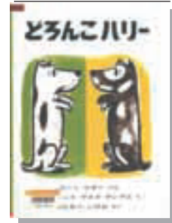
『どろんこハリー』 グレアム 福音館書店