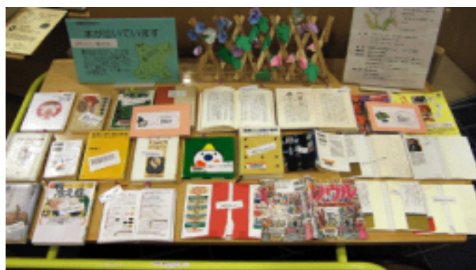
昨年の市民図書館(アピスタ内)での展示風景