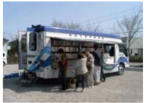
4月から巡回場所を変更した新木野ステーション（气象台記念公園）の利用風景

ご自宅の近くでバスを見かけたり、ドレミの歌（お知らせの曲です）が聞こえたら、一度のぞいてみてください。みなさまのご利用をお待ちしています！