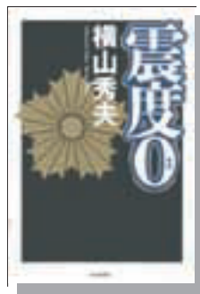
『震度0』 横山秀夫 朝日新聞社