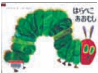
『はらぺこあおむし』 エリック=カール 偕成社