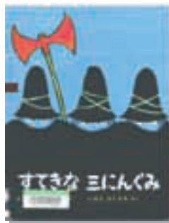
『すてきな三にんぐみ』 トミー=アンゲラー 偕成社