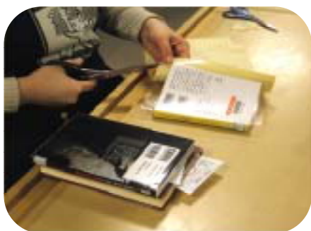
フィルムコーティング講習