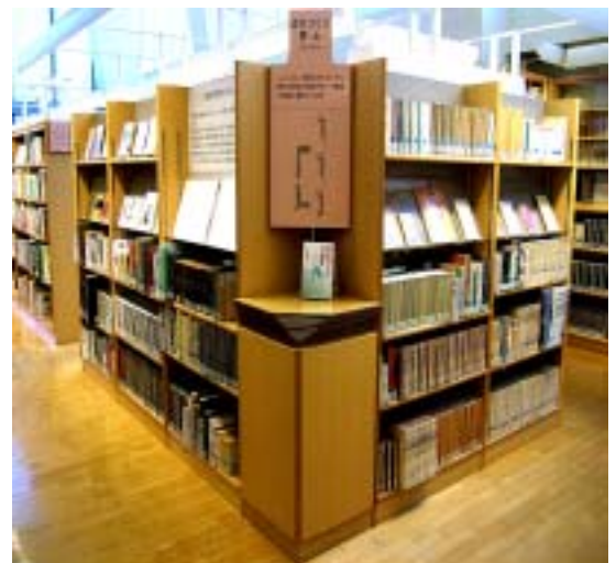
まちづくり/郷土コーナー