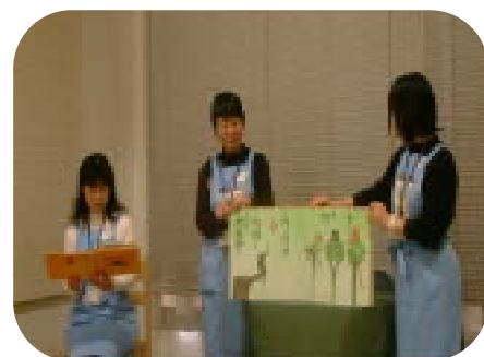
大型絵本の読みきかせ