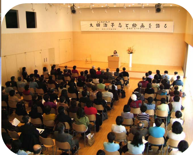
太田治子氏講演会場(アビスタホール)