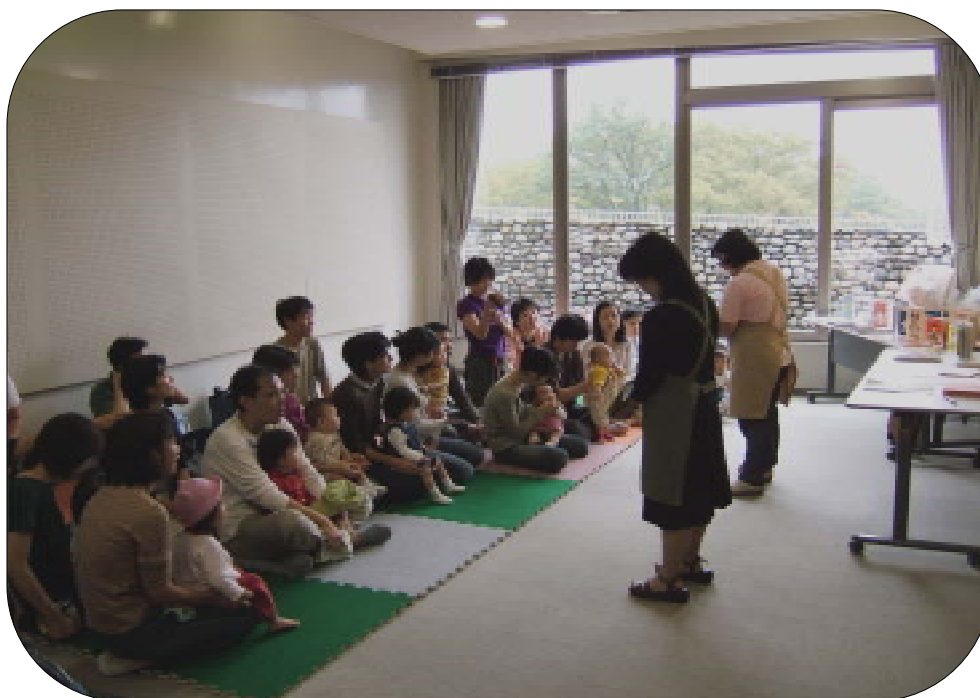
ミッフィータイム土曜版<平成17年10月8日(土)アビスタで開催> 大勢の方がお越しになり好評でした。