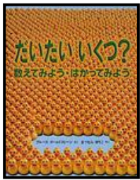
「だいたいいくつ?」 ブルース・ゴールドストーン/さく まつむらゆりこ/やく 福音館書店 (410)

たしざんやひきざんが わからなくても、 おはなしのなかの 「数」は こんなにたのしい!