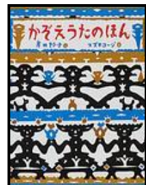
「かぞえうたのほん」 岸田 衿子/さく スズキコージ/え 福音館書店 (EAス)