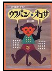
「ウラパン・オコサ」 谷川晃一/作 童心社 (EMタ)

1はウラパン、2はオコサ。 じゃあ、きみのはなは? くちは? たのしいかずあそびの本。