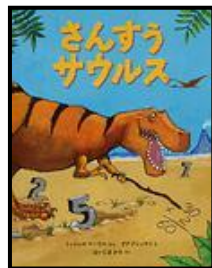
「さんすうサウルス」 ミッシェル マーケル/ぶん ダグ クシュマン/え はいじま かり/やく 福音館書店 (EMク)