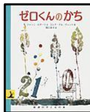
「ゼロくんのがち」 ジャンニ・ロダーリ/文 エレナ・デル・ヴェント/絵 関口 英子/訳 岩波書店 (EAデ)