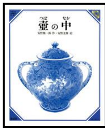
「壺の中」 安野 雅一郎/作 安野 光雅/絵 童話屋 (EMア)