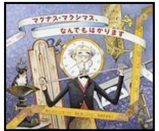
「マダナス・マキシマス、 なんでもはかります」 キャスリーン・T・ペリー/文 S.D.シンドラー/絵 福本友美子/訳 光村教育図書 (EAシ)

本のラベル 410~419 のところに 「さんすう」の本が あつまってます。見てみてね!