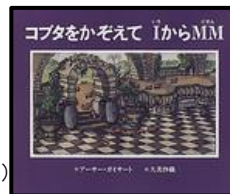
「コブタをかぞえて」からMM アーサー・ガイサート/作 久美 沙織/訳 BL出版 (EMガ)