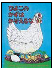
「ひよこのかずはかぞえるな」 イングリッド・レア、 エドガー・パーリン・ドーレア/さく せたていじ/やく 福音館書店 (EAド)