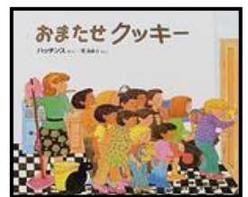
「おまたせクッキー」 パット=ハッチンス/さく 乾侑美子/やく 偕成社 (EAハ)

1はウラパン、2はオコサ。 じゃあ、きみのはなは? くちは? たのしいかずあそびの本。