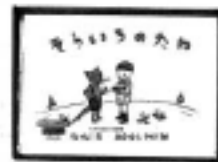
「そらいろのたね」 中川李枝子／さく 大村百合子／え 福音館書店