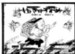
「したきりすずめ」 石井綾子／再話 赤羽末吉／画 福音館書店