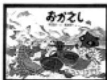
「おかえし」 村山桂子／さく 織茂藤子／え 福音館書店