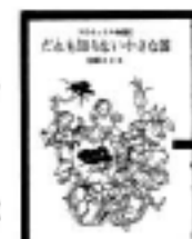
「だれも知らない 小さな国」 佐藤さとる／作 村上勉／絵 講談社