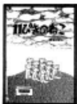
「11ぴきのねこ」 馬場のぼる／作 こくま社