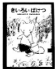
「さいろいばけつ」 もりやまみやこ／作 つちだよしはる／絵 あかね書房