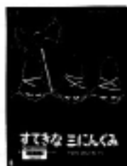
「すてきな三にんぐみ」 トミー・アンゲラー／さく いまえよしも／やく 信成社