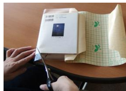
⑨裏表紙側も⑤と同様に、貼りしろ部分「天」「地」2箇所に、斜めの切り込みを入れる。