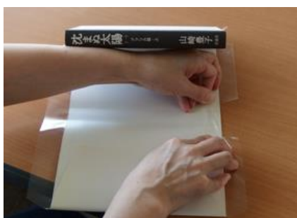
⑩裏表紙側も⑥と同様に貼りしろ部分を折り返して貼る。本からカバーをはずし、背のブックフィルム2箇所をカバー側に折り返して貼る。