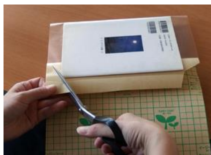
⑧②と同様に切り込みを入れる。