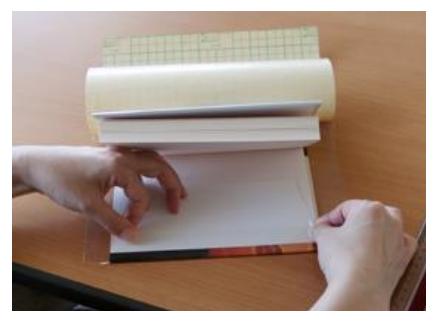
⑥表紙を開き、貼りしろ部分を折り返して貼る。