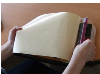
④ブックフィルムの裏紙を剥がし、定規で空気を追い出しながら貼る。