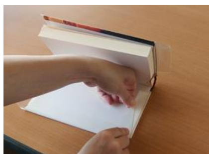
⑪そで部分のブックフィルムを折り返して貼る。