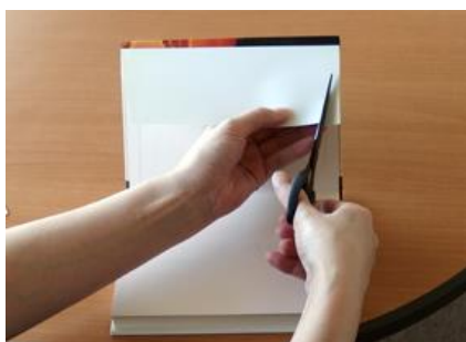
①本のカバーの「そで」部分を「天」と「地」2箇所を切る。