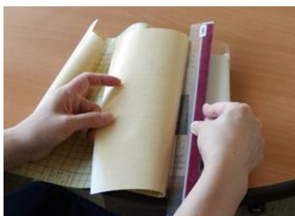
⑦④と同様にブックフィルムを貼る。