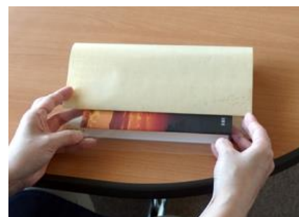
③貼りしろの裏紙部分を剥がし、接着部分をよく押えて貼る。