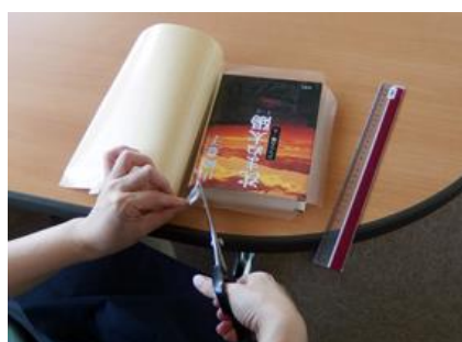
⑤貼りしろ部分「天」「地」2箇所に斜めの切り込みを入れる。