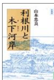
『利根川と木下河岸』