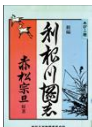
『あびこ版新編利根川図志』

我孫子市役所ホームページ内の手賀沼水族館もご利用ください。 (トップページ→イベント・文化・スポーツ→自然の中で楽しむ→手賀沼)