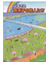
『ふるさと我孫子の先人たち』