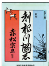
『あびこ版新編利根川図志』

我孫子市役所ホームページ内の手賀沼水族館もご利用ください。 (トップページ→イベント・文化・スポーツ→自然の中で楽しむ→手賀沼)